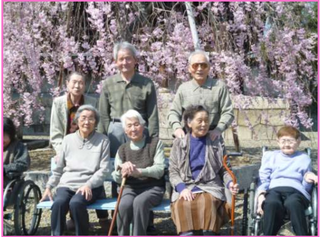
笑顔と満開のしだれ桜が嬉しい日でした。 東御坊(長福寺)