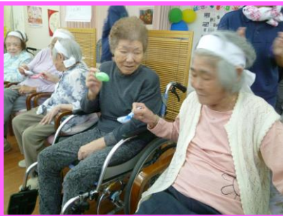
れんげで小物送り