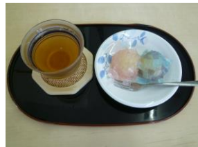
夏の和菓子 (紫陽花)